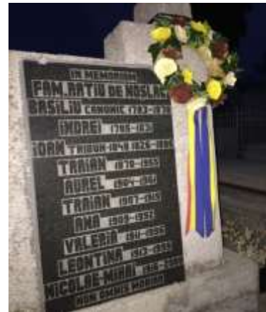
Foto Nr. 6, Placa memorială a familiei lui Indrei Rațiu de Noșlac, Cimitirul Bisericii Rățeștilor, Turda Veche