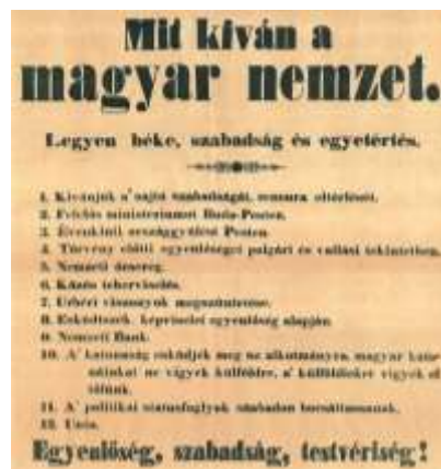
Foto Nr. 1, Proclamația revoluției ungare