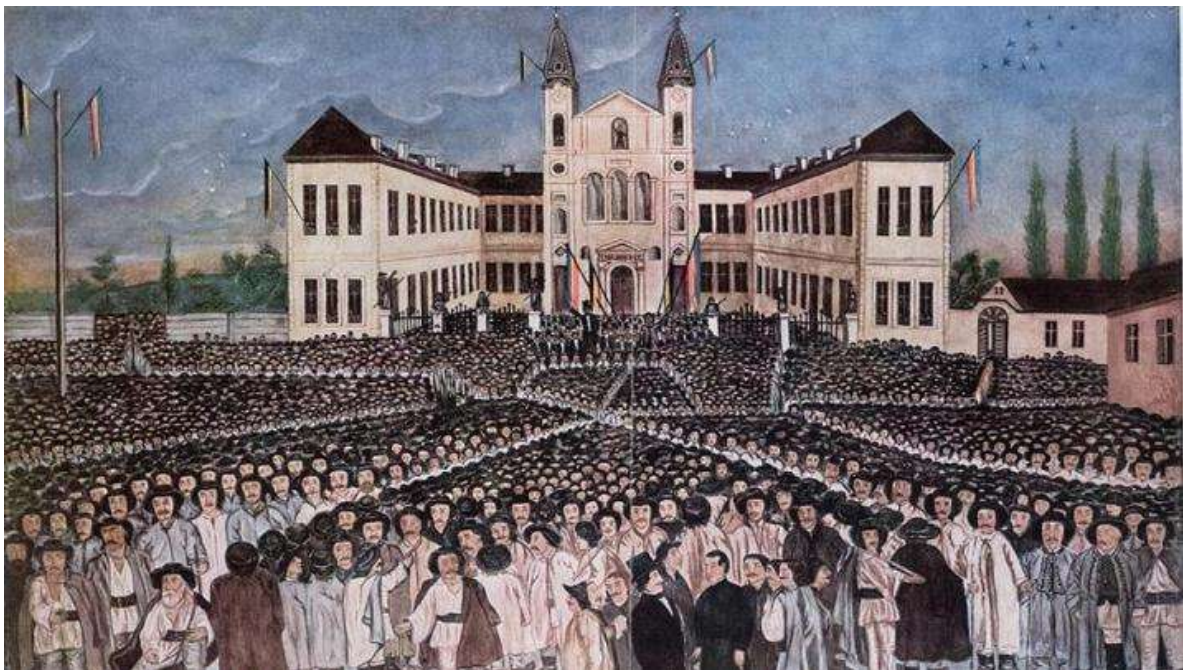
Foto nr. 1, Pictură din epocă, Marea Adunare Națională de la Blaj

A II-a adunare de la Blaj sau Marea Adunare de la Blaj a avut loc la două săptămâni după Duminica Tomii, în 3/15 Mai 1848.