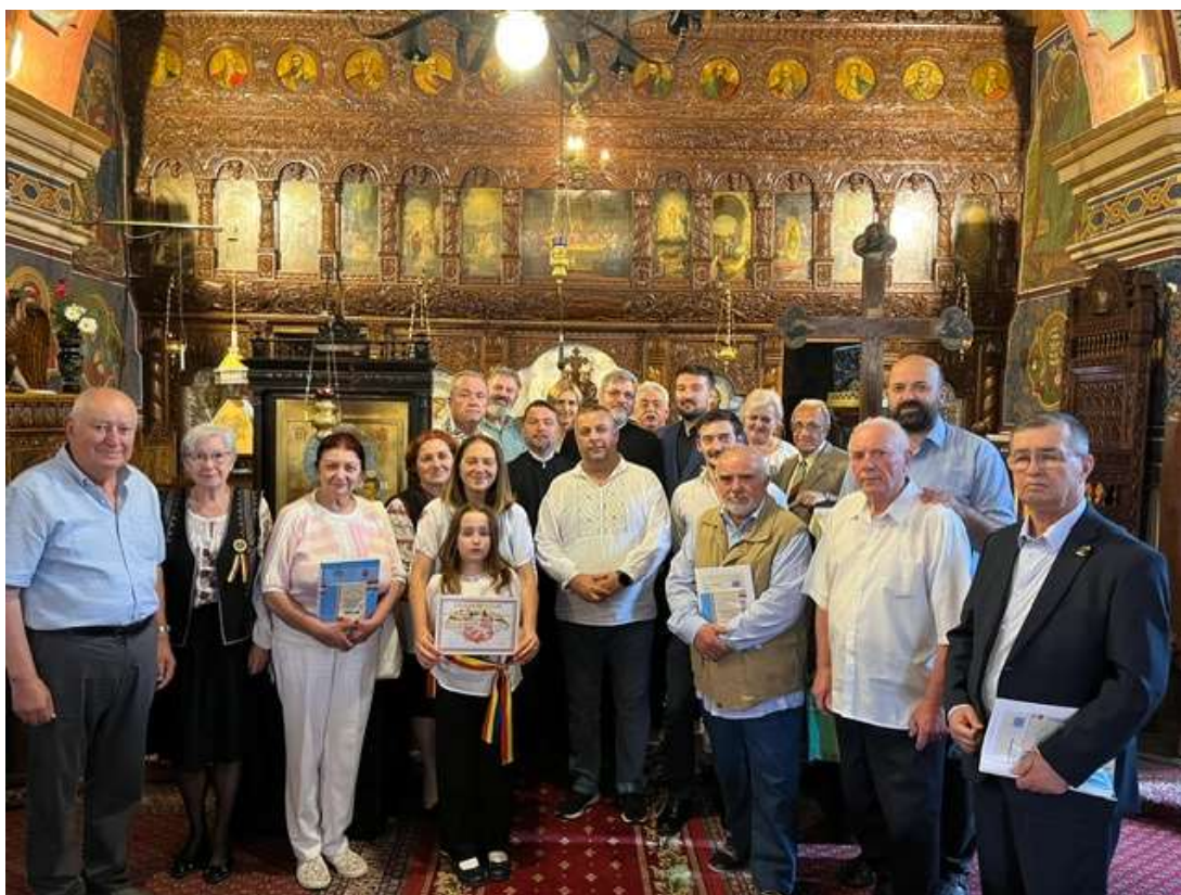
Foto nr. 1, Participanții la lansarea din Biserica Fam. Rațiu, Turda Veche

În perioada 26 - 27 iulie a.c. lucrarea va fi prezentată și în cadrul conferinței « Zilele Academice „Petru Șpan”, Ediția a III-a, Lupșa, 2024 ».