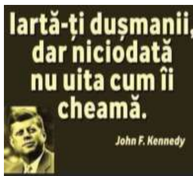
Foto Nr. 2, J.F. Kennedy

Înțelepciunea umană universală ne îndeamnă și ne învață să ne iertăm cât putem de mult dușmanii, dar să nu-i uităm deloc și niciodată cum îi cheamă, ca istoria să nu se mai repete, ca în anii 1848-1849, 1916-1920, 1940-1945, 1989, 1990! (Foto Nr. 2, sursa: Internet)