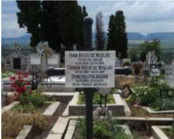
Foto Nr. 5, Placa de mormânt, Ioan Rațiu Tribunalul, Cimitirul Bisericii Între Români, Turda Veche