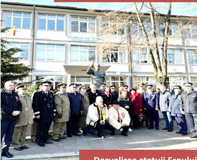
Dezvelirea statuii Eroului Național pr. dr. Vasile Lucaciu

MANIFESTĂRI DEDICATE ZILEI NAȚIONALE A ROMÂNIEI 1 Decembrie 2022