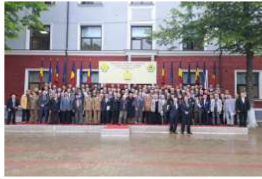
Fotografie de grup, ATM-74 de ani