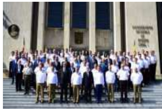
Fotografie de grup, UNAP, 27 iunie 2023