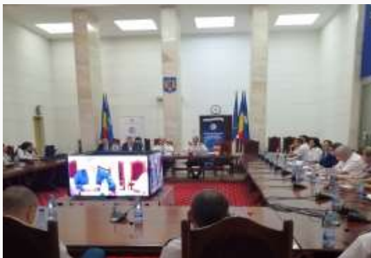
Sala Senatului UNAP