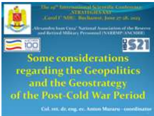
Slide-ul nr. 1 al prezentării