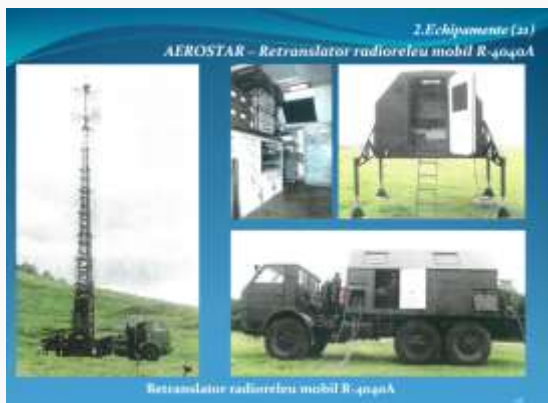
Radiotranslator radioreleu românesc R-4040A