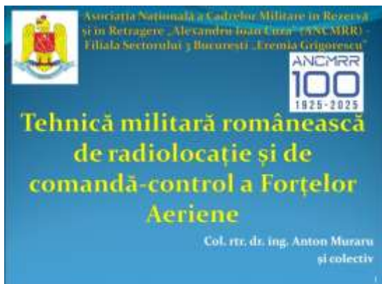
Slide-ul nr. 1 al prezentării