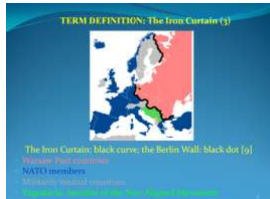
Cortina de Fier (1945-1991)