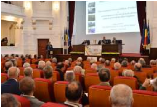
Festivitatea de aniversare în Aula Magna a ATM