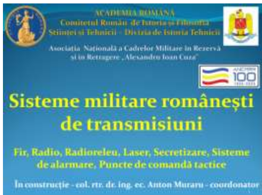
Slide-ul nr. 1 al prezentării