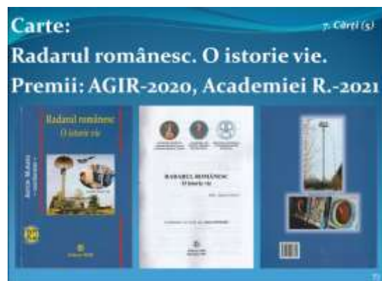
Cartea „Radarul românesc. O istorie vie” (Premiul AGIR-2020, Premiul AR-2021)