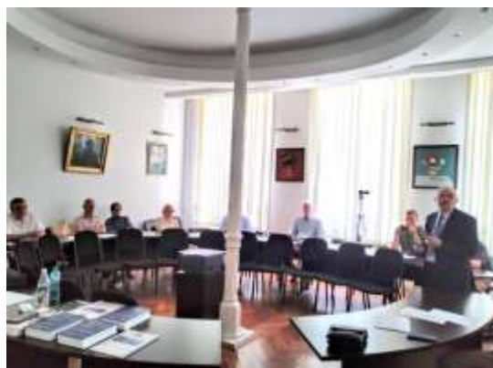
Prezentare comunicare în Sala de Consiliu a AR

În preambulul prezentărilor s-a marcat momentul aniversar 100 de ani al ANCMRR , s-au făcut invitații de aderare la Asociație adresate rezerviștilor neafiliați și s-a subliniat faptul că o parte semnificativă dintre membrii ANCMRR, deși în rezervă și în retragere, nu au abandonat activitatea creativă (cercetare, publicistică, evocări etc.), obținând rezultate meritorii, răsplătite cu diplome de excelență și premii, inclusiv Premiul Academiei Române.