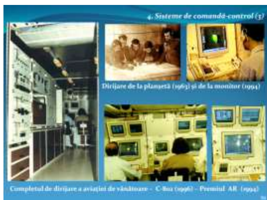
Completul românesc de dirijare a aviației de vânătoare C-802 (Premiul Academiei Române, 1994)