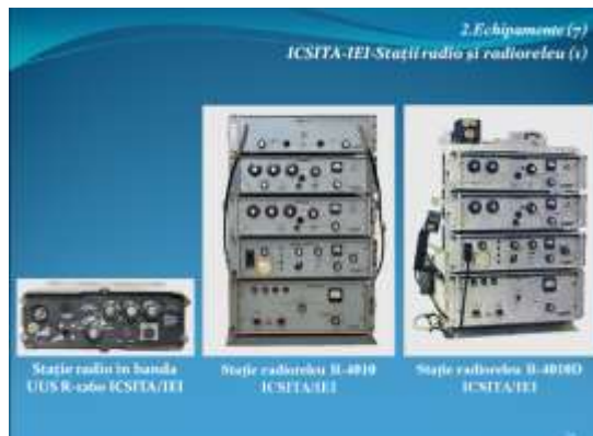
Stații românești de radio și radioreleu