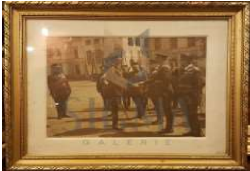
Regele Carol al II-lea primind raportul generalului PION. 6

general, prilej cu care i-a oferit în dar un tablou înrămat de o valoare afectivă de neșters.