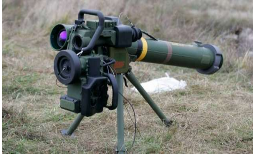
Instalația de lansare Spike LR

Introduse în dotare în urma cu câțiva ani, instalațiile Spike sunt considerate a fi la această dată, unele din cele mai moderne sisteme de rachete antitanc dirijate. Rachetele Spike își dovedesc eficacitatea în prezent în războiul din Ucraina, unde au reușit să anihileze numeroase tancuri rusești.