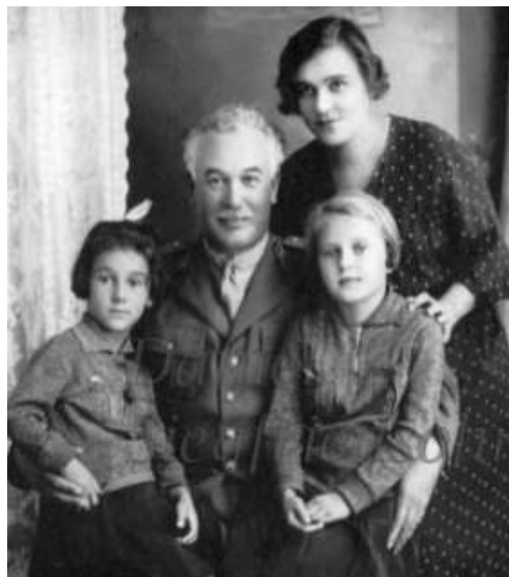
Familia generalului Pion Georgescu

În ultima parte a activității sale a comandat Corpul 7 Teritorial cu reședința în garnizoana Sibiu . Aici la 1 septembrie 1940 a participat pe străzile orașului împreună cu ofițerii săi în fruntea manifestațiilor, la demonstrația împotriva odiosului Dictat de la Viena (care rupea din teritoriul României o suprafață de 43 492 kilometri pătrați cu circa 2 667 000 de locuitori, dintre care peste 50 % erau români). S-a adresat demonstrațiilor mai întâi de la fereastra casei sale, apoi a coborât în stradă unde a participat la protest în fruntea sibienilor.