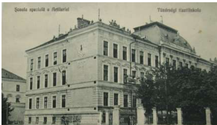
Școala Militară de Artilerie din Timișoara, în perioada interbelică

Prin urmare un loc aparte în activitatea sa profesională a reprezentat-o perioada desfășurată în cadrul Școlii Militare de Artilerie din Timișoara . Meritele din domeniul învățământului militar aveau să fie răsplătite prin deplina lor recunoaștere materializată prin numirea sa în funcția de comandant al școlii. A rămas memorabil primul său Ordin de Zi pe Unitate nr. 17 din 1926, în această calitate, reprezentând în fapt sinteza crezului său profesional: