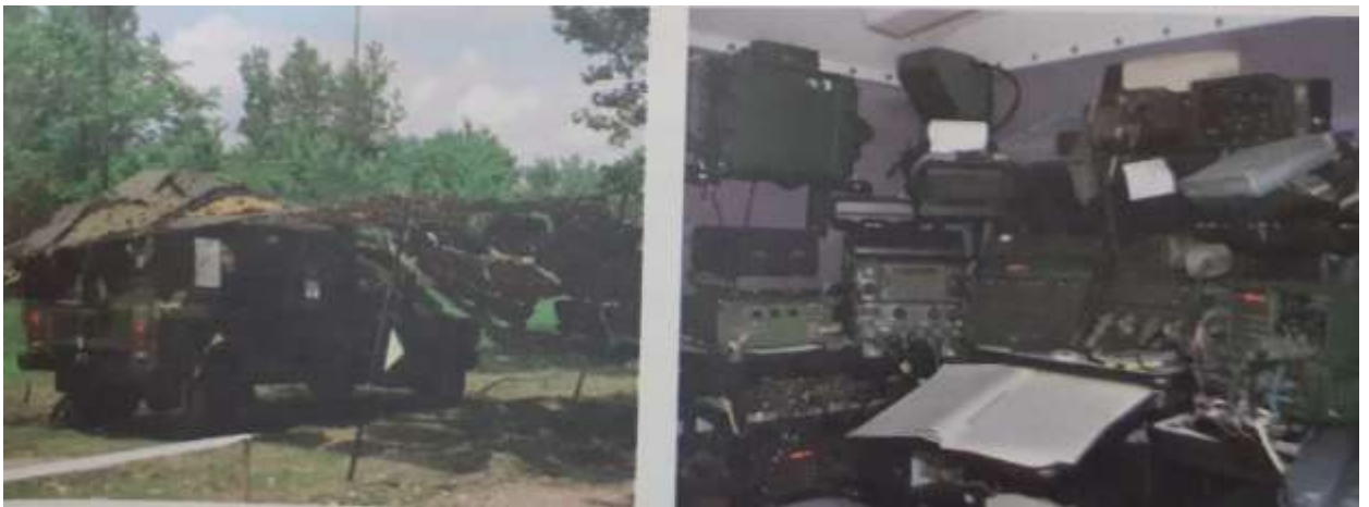
Autostație radio Panther 2000 H

Toate aceste eforturi au continuat până când conducerea politico - militară română a luat hotărârea de intrare în NATO, ocazie cu care s-a făcut trecerea la o nouă înzestrare cu tehnică de comunicații modernă specifică Alianței Nord Atlantice.