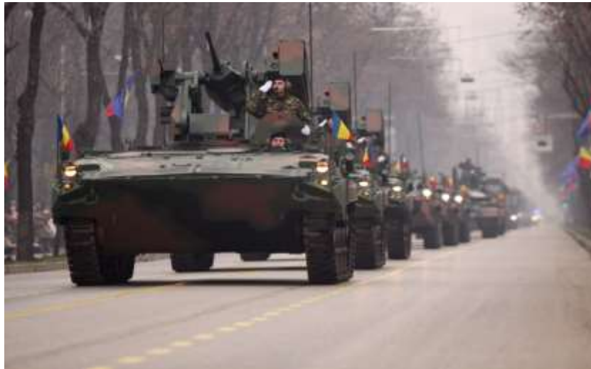
MLI 84 M dotat cu lansatorul dual Spike LR

Produse de israelienii de la Rafael, rachetele fac parte din generația 4++, la noi fiind integrate în variantele: portabil, pe elicopterul IAR 330 Puma Socat și pe MLI 84 M.