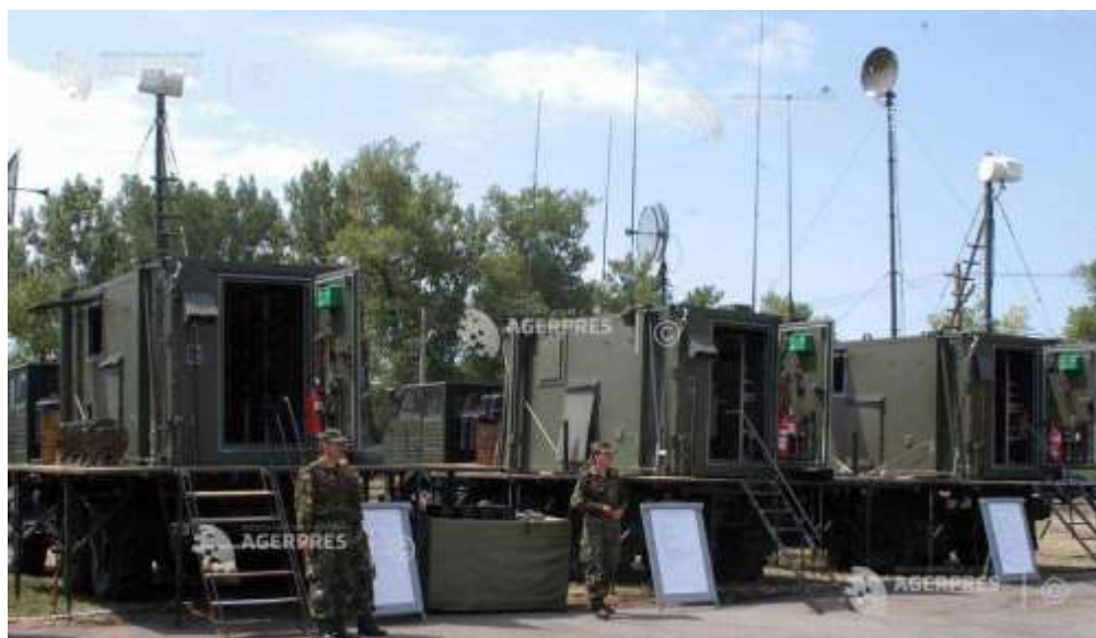
Tehnica actuală de transmisiuni