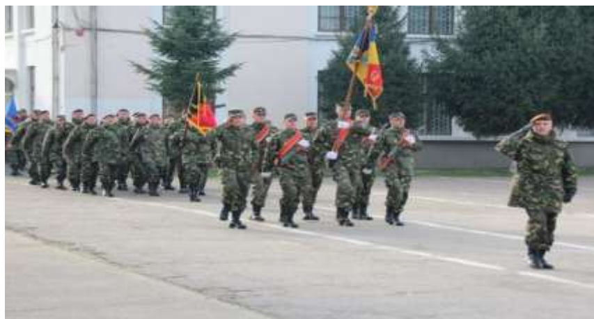
În pas de defilare

Pe data de 1 octombrie 2018 , în centrul municipiului Caracal a avut loc un fastuos ceremonial militar-religios, organizat cu ocazia sărbătoririi a 50 de ani de la înființarea unității în prezența unei numeroase asistențe de locuitori ai orașului. Cu prilejul acestui jubileu, Drapelul de luptă al unității a fost decorat cu „Emblema de Onoare a Forțelor Terestre” , pentru rezultatele foarte bune obținute.