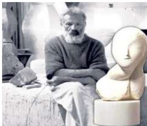
Brâncuși în atelierul din Montparnasse

În 1904 pleacă la studii la Main în Germania , însă după numai 6 luni o pornește pe jos prin Bavaria, Elveția apoi ajunge în orașul Langres din Franța, de unde ia trenul până la Paris. Pe timpul șederii în capitala Franței primește o bursă anuală de 600 de lei din partea statului român. La început lucrează în atelierul cunoscutului sculptor Rodin, însă după un timp dându-și seama că pastișează 1 cu stilul acestuia îl părăsește și își deschide propriul atelier de sculptură în cartierul Montparnasse pentru a putea să-și pună în operă propriile sale idei, de care nu ducea lipsă.