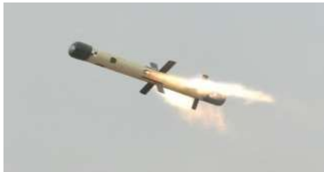
Zborul rachetei Spike L R

Spike LR 4 are o bătaie de la 200 până la 4000 de metri. Această variantă este montată și pe MLI 84 M, în lansatoare duble (cu câte două rachete), putând fi folosită prin ghidaj sau fire-and-forget. RHA-ul raportat pentru Spike LR ar fi de +700 mm în blindaj, lovind partea superioară (cea mai vulnerabilă - turela) a tancului. Se estimează că toate MLI-urile 84 M vor fi dotate cu lansatoare de tip Spike.