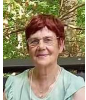
Poet Doina BONESCU - „Fata din munți” -