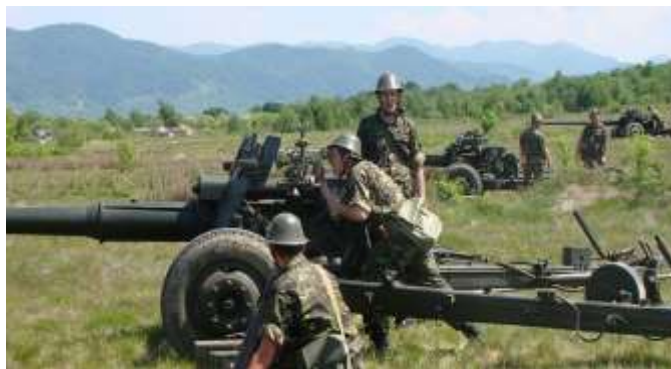
Trageri directe cu bateria TAT cal 100 mm

Au urmat aplicații cu un grad sporit de dificultate, precum: „Timiș '91” și „Banat '93”, activități la care unitatea a fost apreciată cu calificative foarte bune.