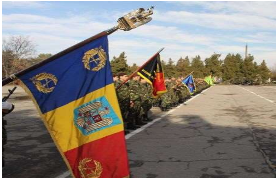
Drapelul de luptă al unității

Un moment de referință în viața militarilor Divizionului 325 Artilerie Antitanc, l-a constituit primirea noului Drapel de luptă 2 , compatibil cu denumire care-i fusese atribuită recent.