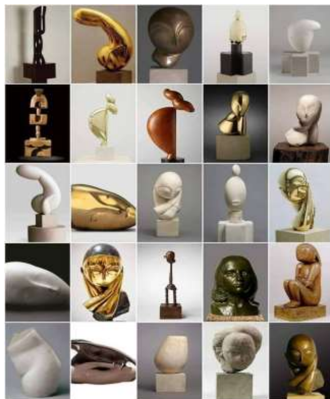
O mică parte din cele 204 opere ale lui Brâncuși

Despre el afirma că: „Toată viața mea a fost o succesiune de miracole” adăugând „... .. lucrările mele au o motivație profundă; arta este perfecțiune, este acolo unde este apropiere de suflete, este apropiere de înălțimi”. Și încă: „Domnule, eu am purtat opinci. De regulă opincarii sunt oameni cinștiți, care n-au bani să-și cumpere pantofi. Am întâlnit înțelepți în opinci, am văzut și proști cu joben și monoclu.”