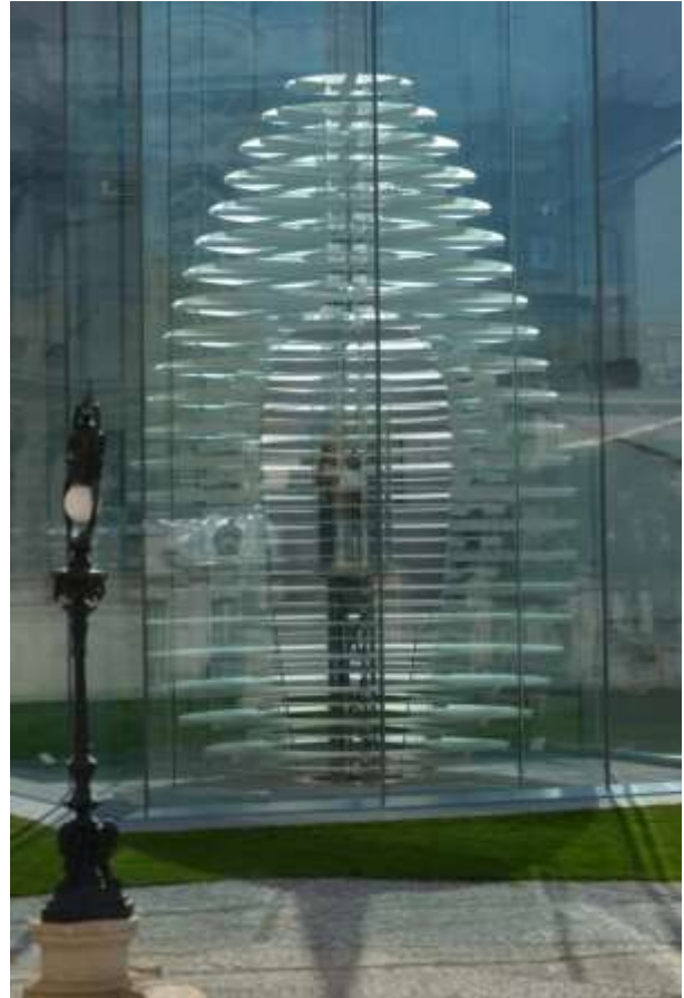
Centrul Internațional „Constantin Brâncuși”

lăsase niciun testament, majoritatea lucrărilor sale au rămas expuse la „ Muzeul de Artă Modernă ” din Paris. Pentru Brâncuși arta a fost har și o misiune divină pe care a situat-o mai presus de orice, ridicând-o la cel mai înalt nivel.