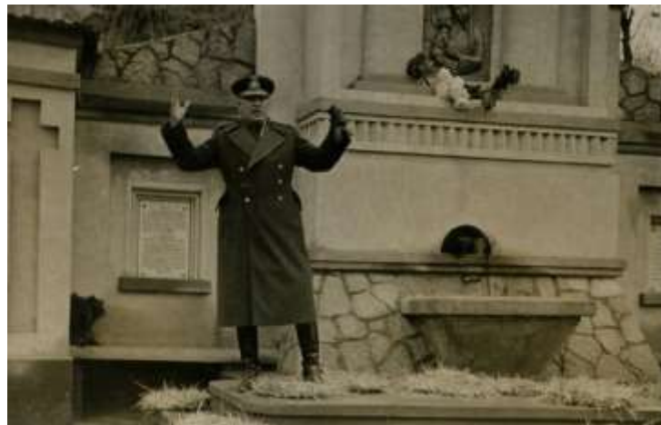
Inaugurarea „Isvorului- monument General Georgescu Pion”

La 20 de ani de la terminarea Războiului Întregirii, cu prilejul comemorării eroilor români căzuți la Mărăști, Mărășești și Oituz, pe când comanda Brigada 15 Artilerie , generalul Pion a realizat la Chișinău din fonduri proprii, un monument natural omagial denumit „ Isvorul general Georgescu Pion ”, care a fost inaugurat și sfințit în ziua de 21 noiembrie 1937.