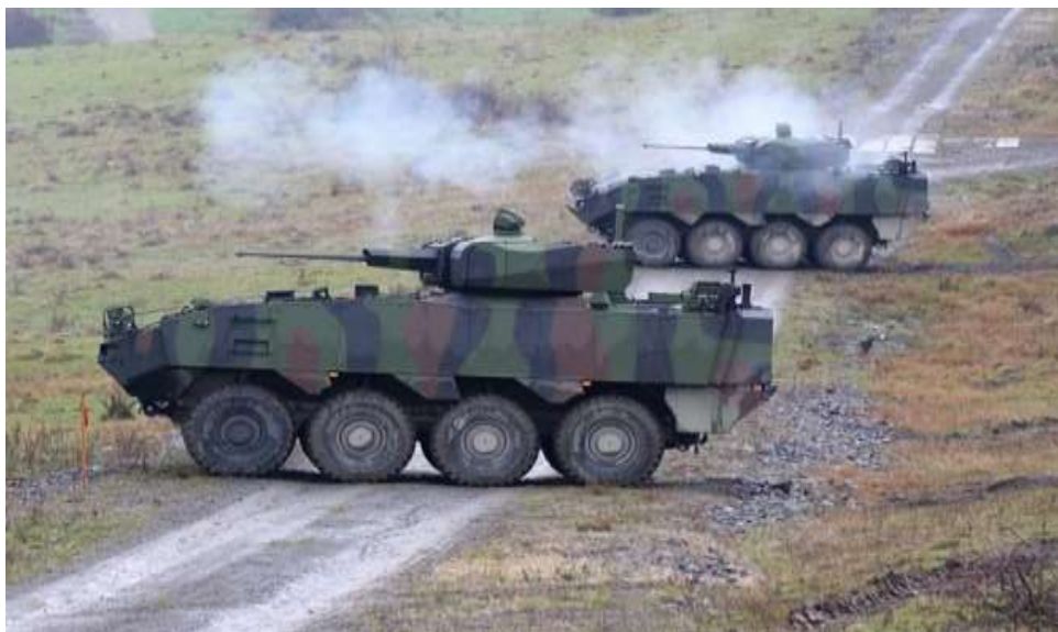
Trageri de luptă în poligonul Cincu

Primele 36 de transportoare blindate Piranha 5 care au intrat în dotarea unităților Armatei române au fost produse de americanii de la General Dynamics în colaborare cu firma elvețiană Mowag Gmb H.