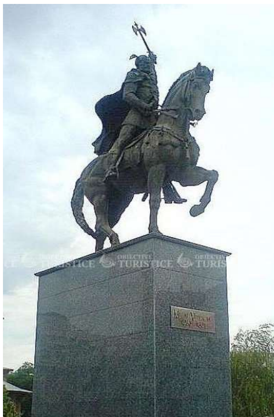
Statuia lui Mihai Viteazul - Craiova