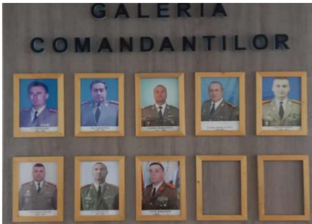
Galeria Comandanților B 26 I „Neogoe Basarab”

Am comandat Batalionul 26 Infanterie „Neogoe Basarab” în perioada 15.09 1994 - 27.07 1998, acționând cu responsabilitate pentru înființarea unității, pregătirea structurilor din batalion pentru apărarea țării și participarea acestora la exerciții și misiuni naționale și multinaționale în teatrele de operații.