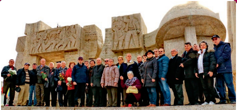
-Buzău – Focșani – Mărăști – Soveja – Panciu – Mărășești (activități organizate în prezența Președintelui României), în anul 2017;