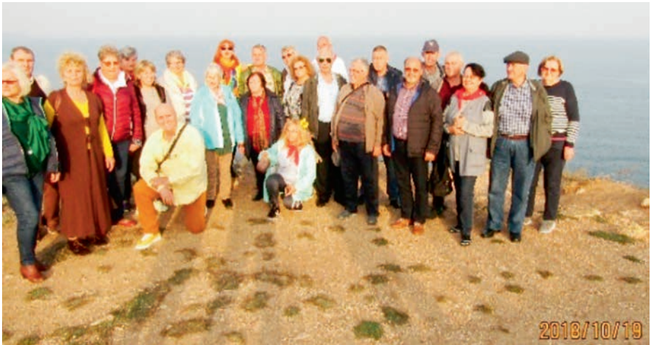
- Focșani – Tecuci – Bârlad – Iași – Republica Moldova (Bălți, Soroca, Mănăstirea Saharna, Orhei, Chișinău, Hâncești, Cimitirul Eroilor de la Țiganca, Găgăuzia, Kahul) – Brăila – Buzău, în anul 2019;