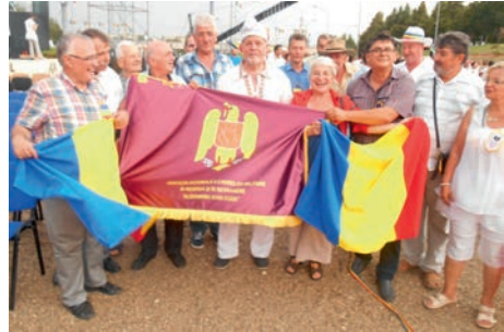
- Mănăstirea Cozia – Sibiu – Hunedoara – Alba Iulia – Transalpina–Complexul Hidroenergetic Ciunget – Craiova – Drobeta-Turnu Severin –Orșova (croazieră pe Dunăre) – Kladovo/Serbia – Vidin, Plevna și Ruse/Bulgaria, în anul 2018;