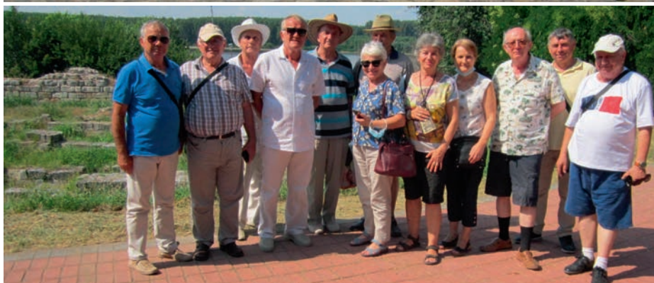
- Zimbrăria Bucșani – Târgoviște/Centru istoric - Mănăstirea Dealul, în anul 2022.