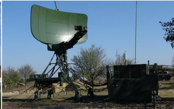
Foto nr. 4, radarul Gap Filler TPS-79