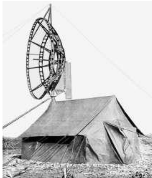
Foto nr. 2, radarul britanic A.N.-T.P.S.-3